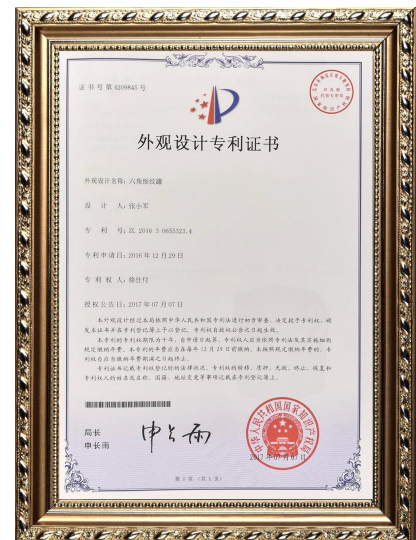
Patent nr: 201630655323.4