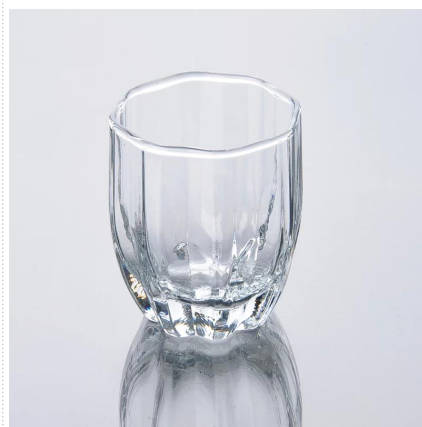
popularne promotioanal szkła