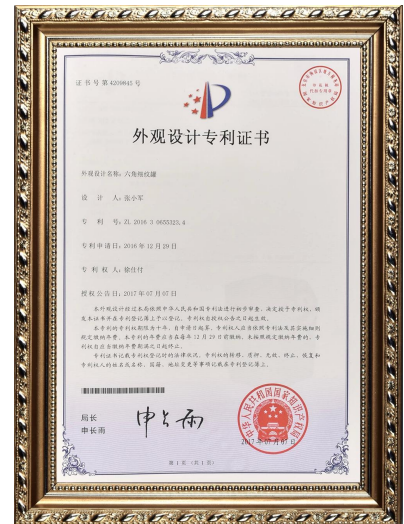
Nr patentowy: 201630655323.4