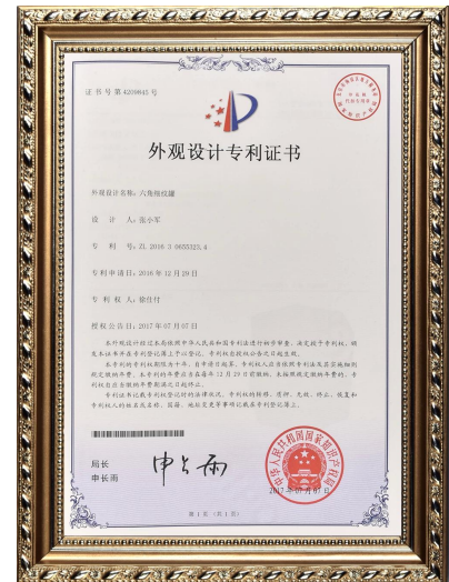
Patent nr: 201630655323.4