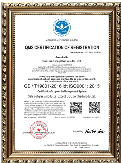
ISO 9001: 2015