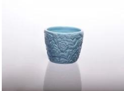
Specjalna ceramika świecznik