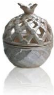
Biały Uchwyt ceramiczne glazura Świeca