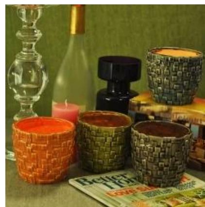
Kolor glazury ceramiczne świecznik