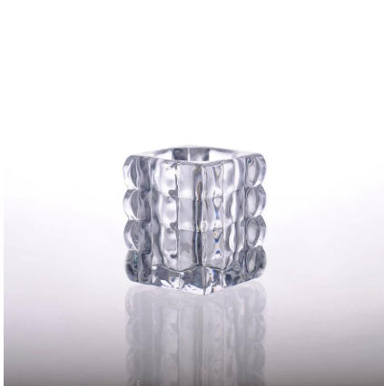
Świecznik szklany kwadrat