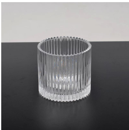
Świecznik ze szkła przezroczystego