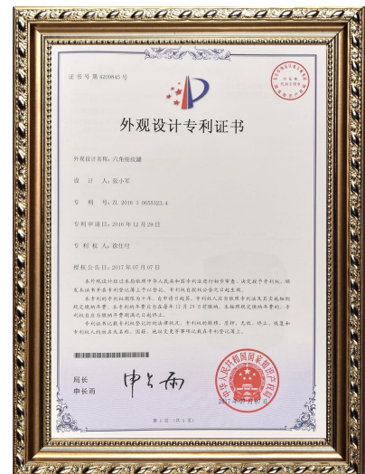
Patent Nr.: 201630655323.4