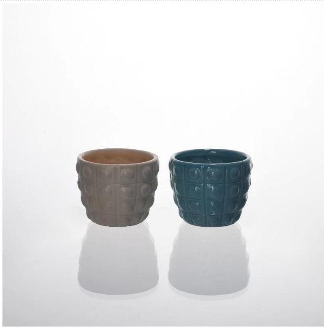
Świecznik kolorowe ceramiczne