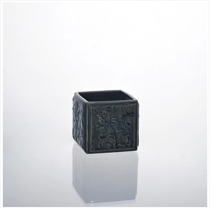
Cylinder ceramiczny świecznik kwadratowy