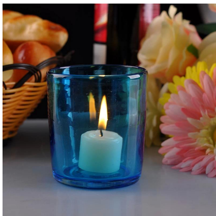
Uchwyt szkła kolorowe świczki