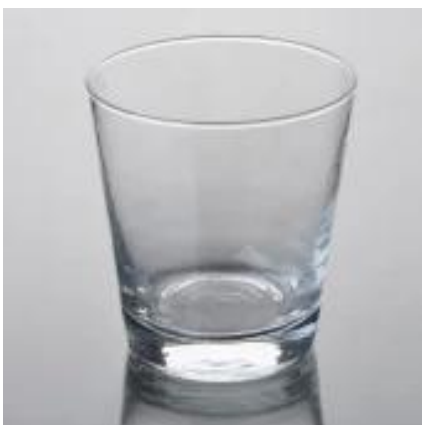
kubek wody pitnej ze szkła