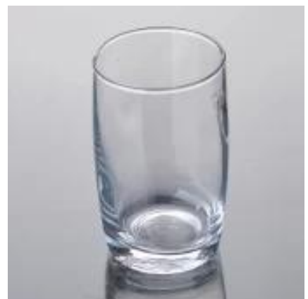
8 uncji highball szkła