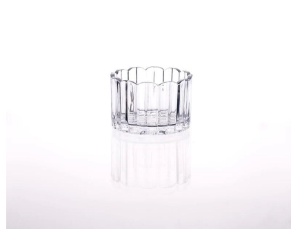
jasne szkło świecznik