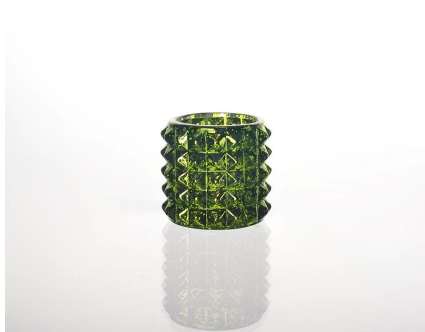
Świeca szkło kolorowe puchar