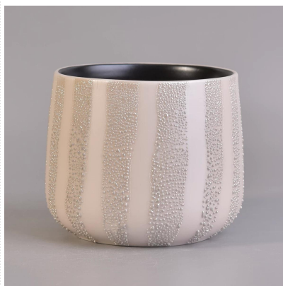
Matowy czarny wewnątrz ceramiczne szkliwione świeca kolorowe słoiki