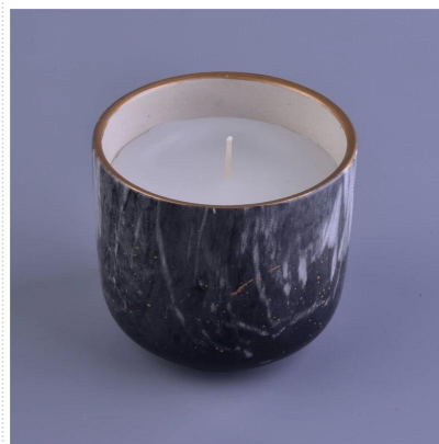
Marmur świece zapachowe w ceramiczna świeca słoik z marmuru naklejki druk