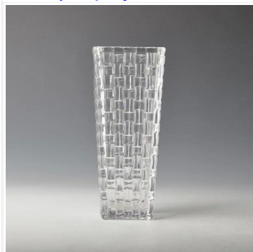
maszyny i dmuchane wazon