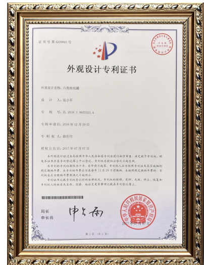
Patent nr.: 201630655323.4