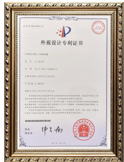
Nr patentu: 201630655323.4