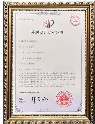
Nr patentu: 201630655323.4