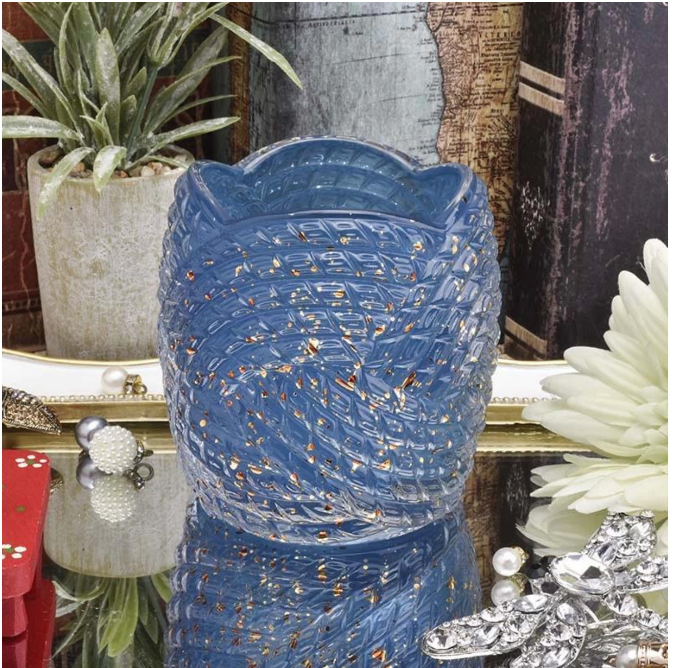
Office & Sample Room