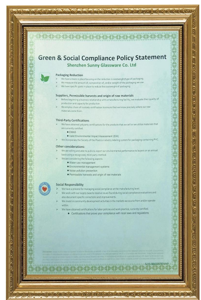
Green & Social compliance Polidy Statement