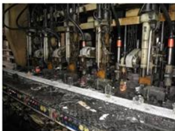
☐ IS Machine