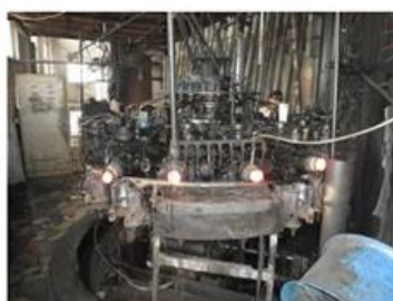
☐ Machine Blown