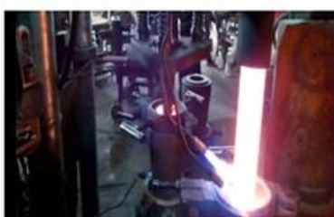
☐ Machine Pressed