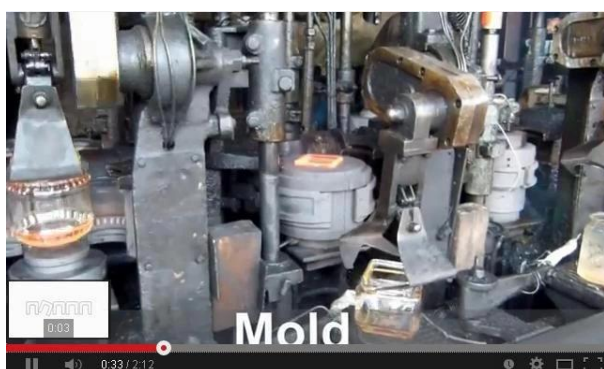
IS Technology Technology