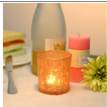
Posiadacze matowego szkła znicz