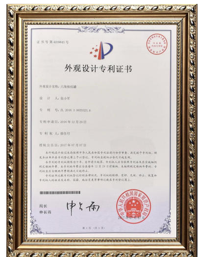
No .: +201630655323,4 patentowy