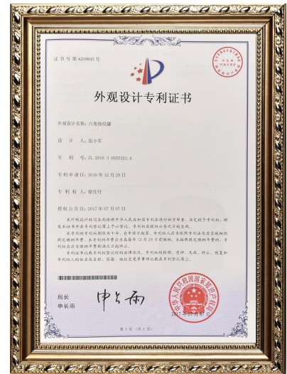
Nr patentu: 201630655323.4