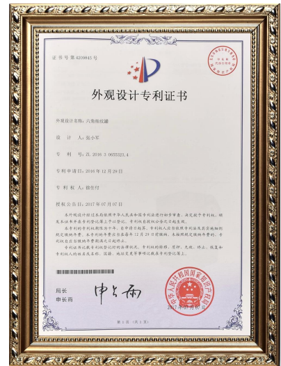
No. Paten: 201630655323.4