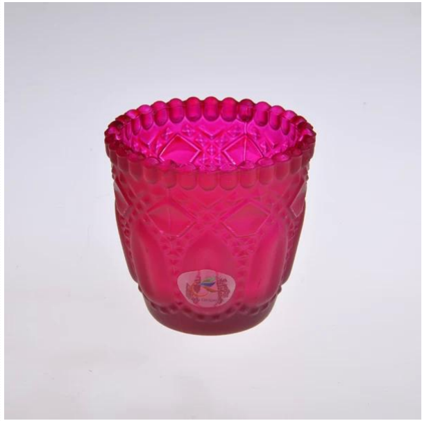
pemegang lilin merah