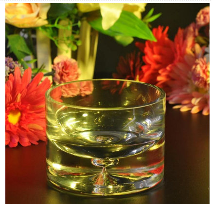
pemegang lilin drop air kaca