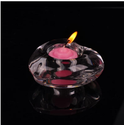
pemegang lilin kaca bentuk hati