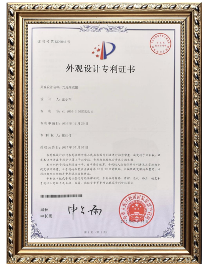
Paten No. : 201630655323.4