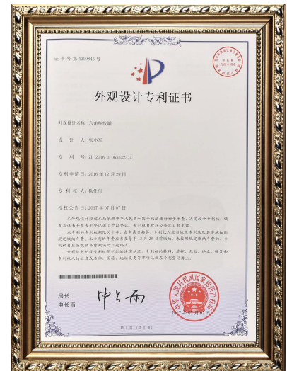
No. paten: 201630655323.4