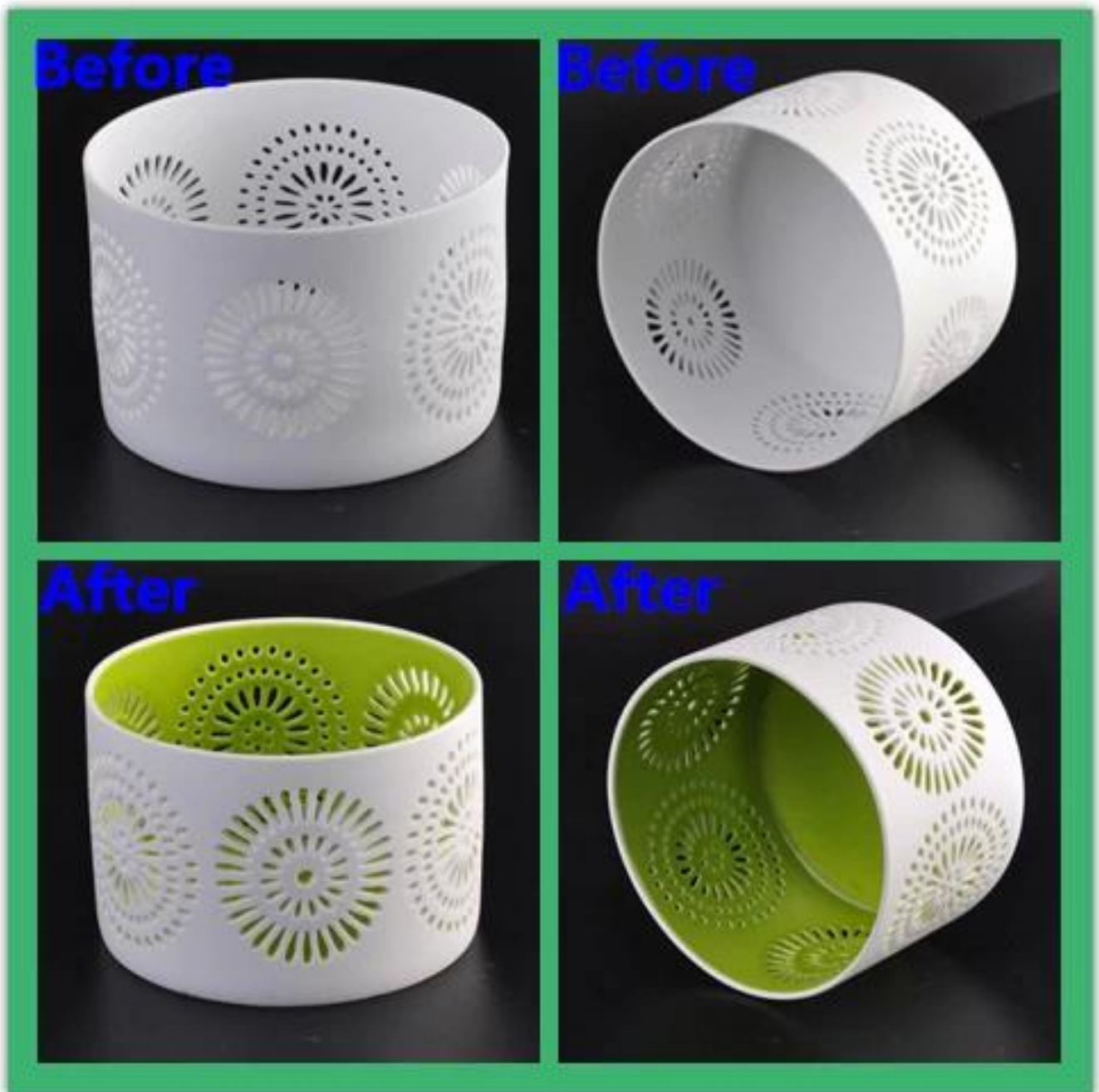
Lebih banyak lilin seramik marmor putih Pemegang-pemegang