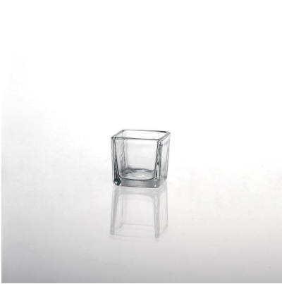
Square membersihkan kaca lilin