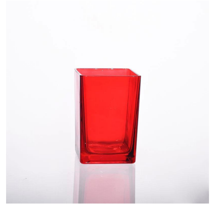
semburan warna kaca lilin