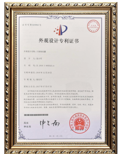
Paten no. : 201.630.655.323,4