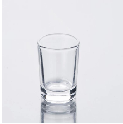
jelas kaca ditembak mini