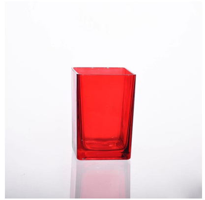
tempat lilin kaca warna semburan