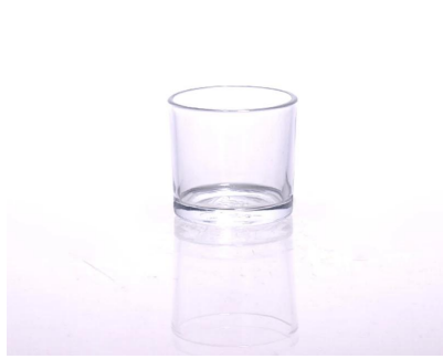
pemegang lilin kaca buatan mesin