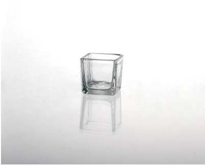
pemegang lilin kaca jernih persegi