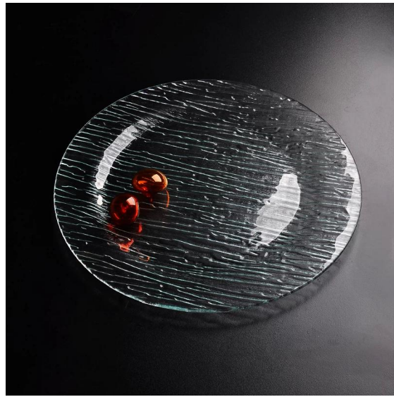
pusingan plat kaca yang jelas