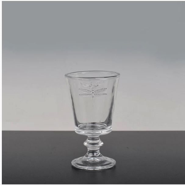
kaca pemegang lilin berpunca