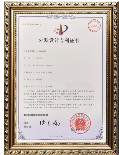
Paten no.: 201630655323.4