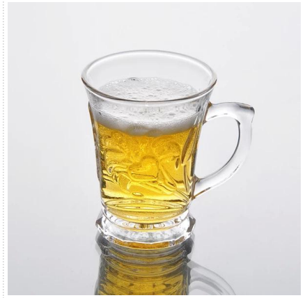
kaca cawan borong