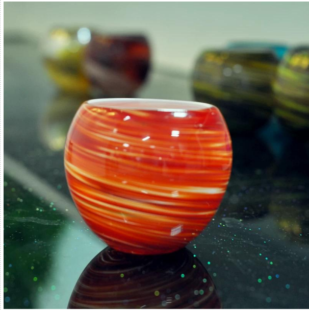
pemegang lilin kaca baru