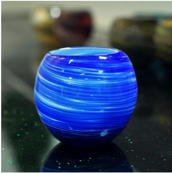
mulut kaca ditiup lilin