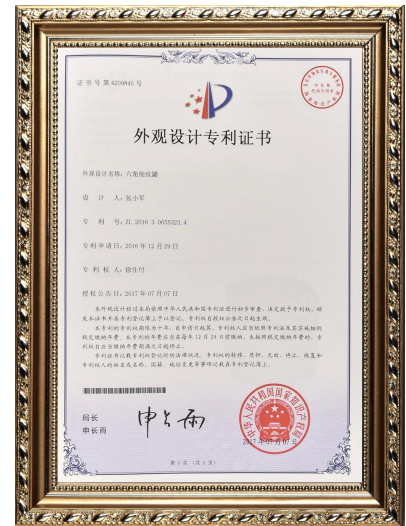
Paten no.: 201630655323.4