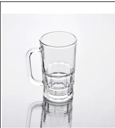
bir cawan kaca yang jelas