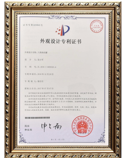
Paten No. : 201630655323.4