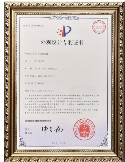
No. paten: 201630655323.4