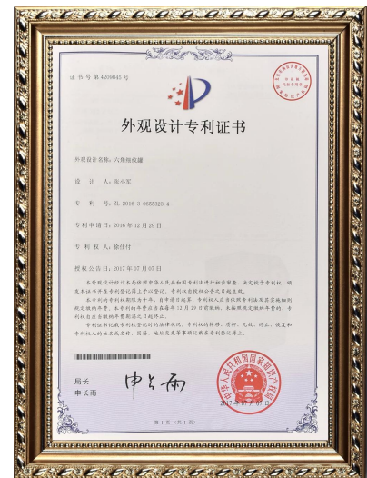
Paten No. : 201630655323.4