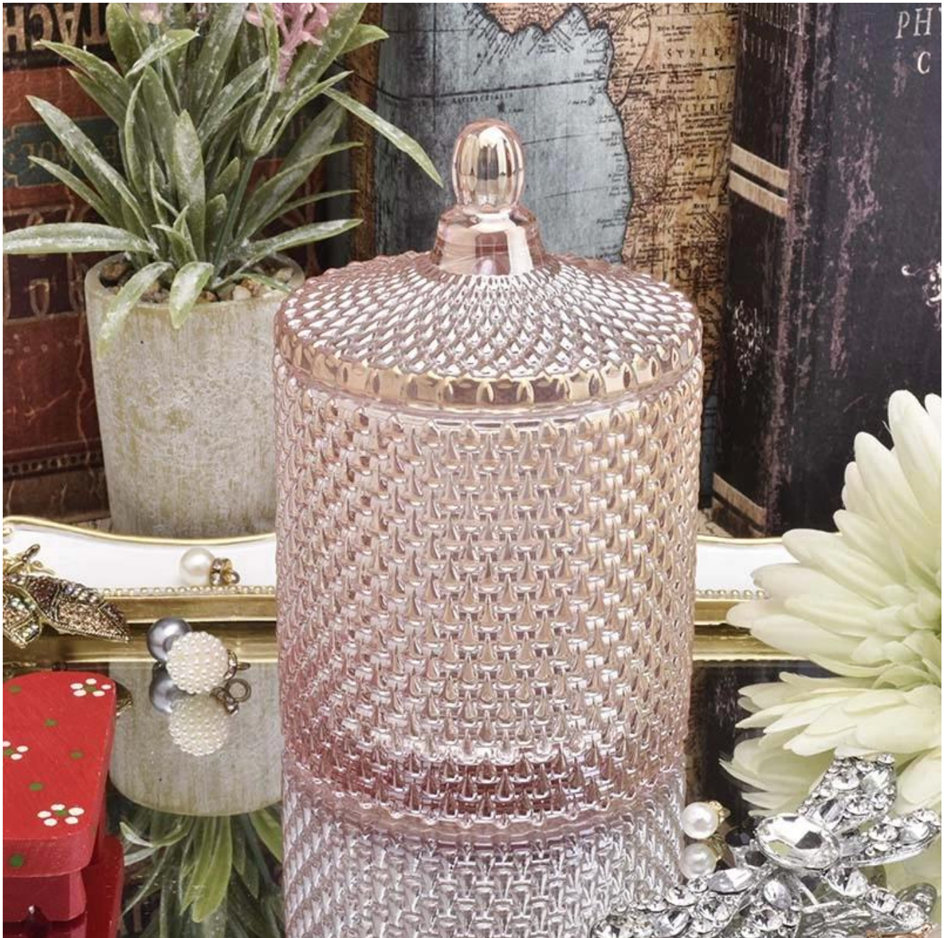
Range of the application