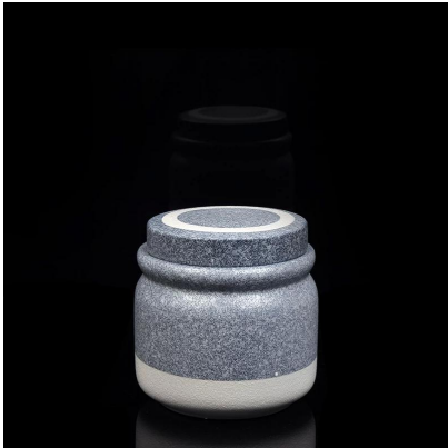
Pemegang lilin seramik dengan kemasan marmar