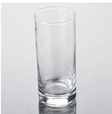
9.5 OZ tanda keberangkatan kaca