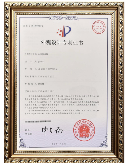
Nombor paten: 201630655323.4