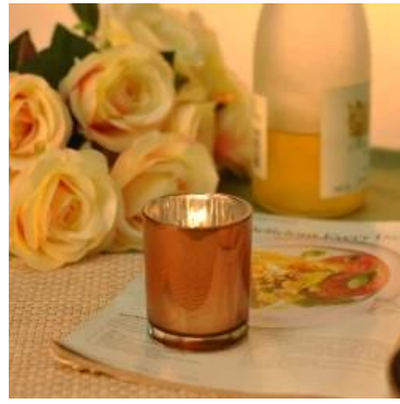
140ml Tembaga Lilin Jar