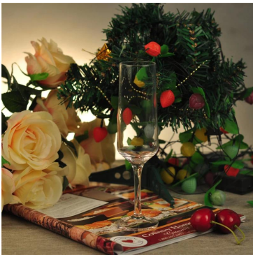
Champange kaca cawan