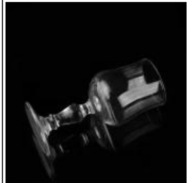
pemegang lilin kaca