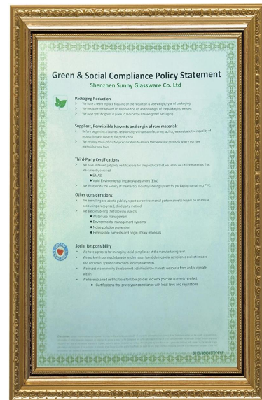
Tanggungjawab sosial dan hijau Kenyataan Polidy