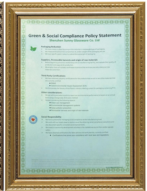
Tanggungjawab hijau dan sosial Penyataan Policy